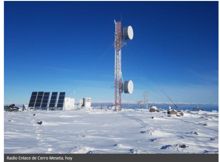
Radio Enlace de Cerro Meseta, hoy